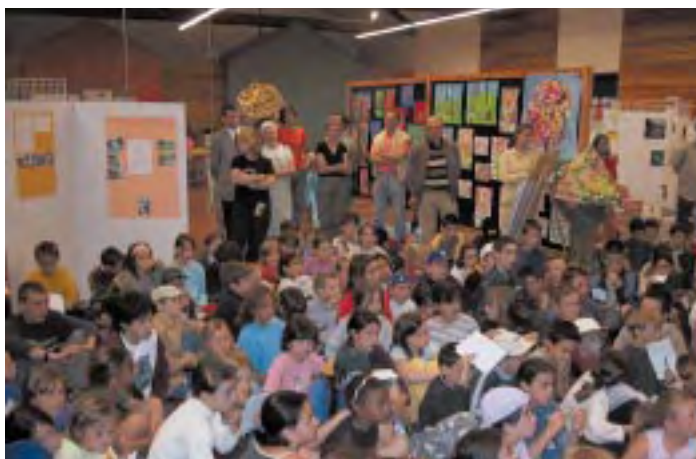
Semaine de l'environnement 2003